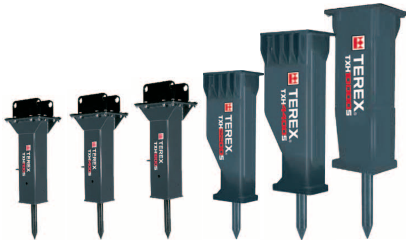
TXH1100S TXH1400S TXH1800S TXH2200S TXH4400S TXH10000S