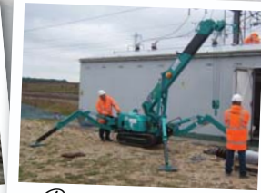
Ремонтные работы на железной дороге