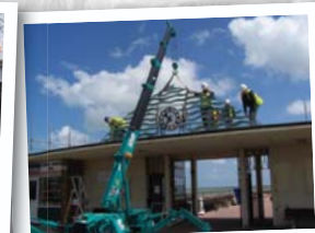
Общие погрузочные работы