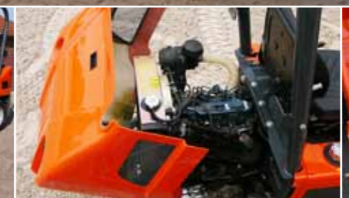
Sauberer, geräuscharmer, leistungsstarker Kubota Motor