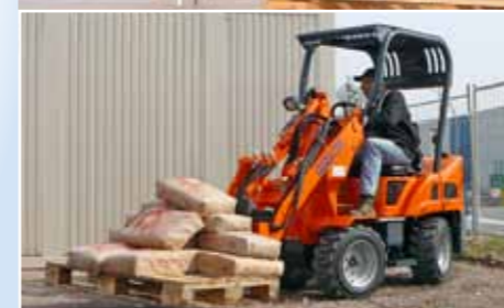
Minimiert schwere körperliche Arbeiten