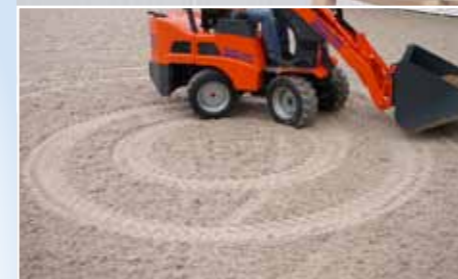
Voller Lenkeinschlag – extreme Wendigkeit