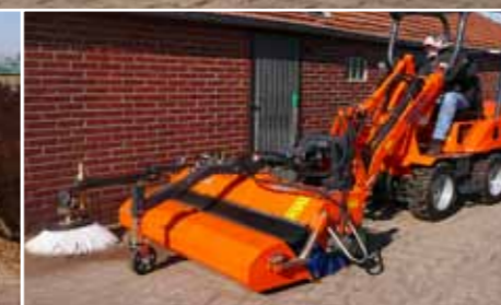
Große Auswahl an Anbaugeräten