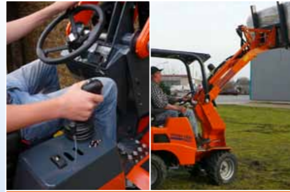
Bedienung mit nur einer Hand per Joystick