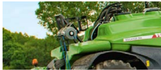
□ L'enrouleur de flexibles, très pratique, installé à l'arrière du pulvérisateur, simplifie le nettoyage.