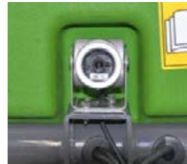
■ Caméra de recul