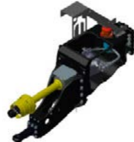
□ ... Attelage haut. Toutes les options restent disponibles, même avec une prise de force.