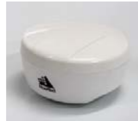
■ Antenne GPS à précision EGNOS