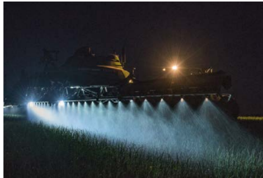
■ Éclairage LED, pour une visibilité optimale sur les buses