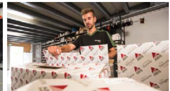
Grâce aux synergies et à AGCO Fendt Service déjà bien établi, vous disposerez des pièces d'usure et de rechange en temps et en heure.