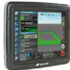
□ Afficheur 10,4", à utiliser comme deuxième terminal, pour une vue d'ensemble encore plus claire.