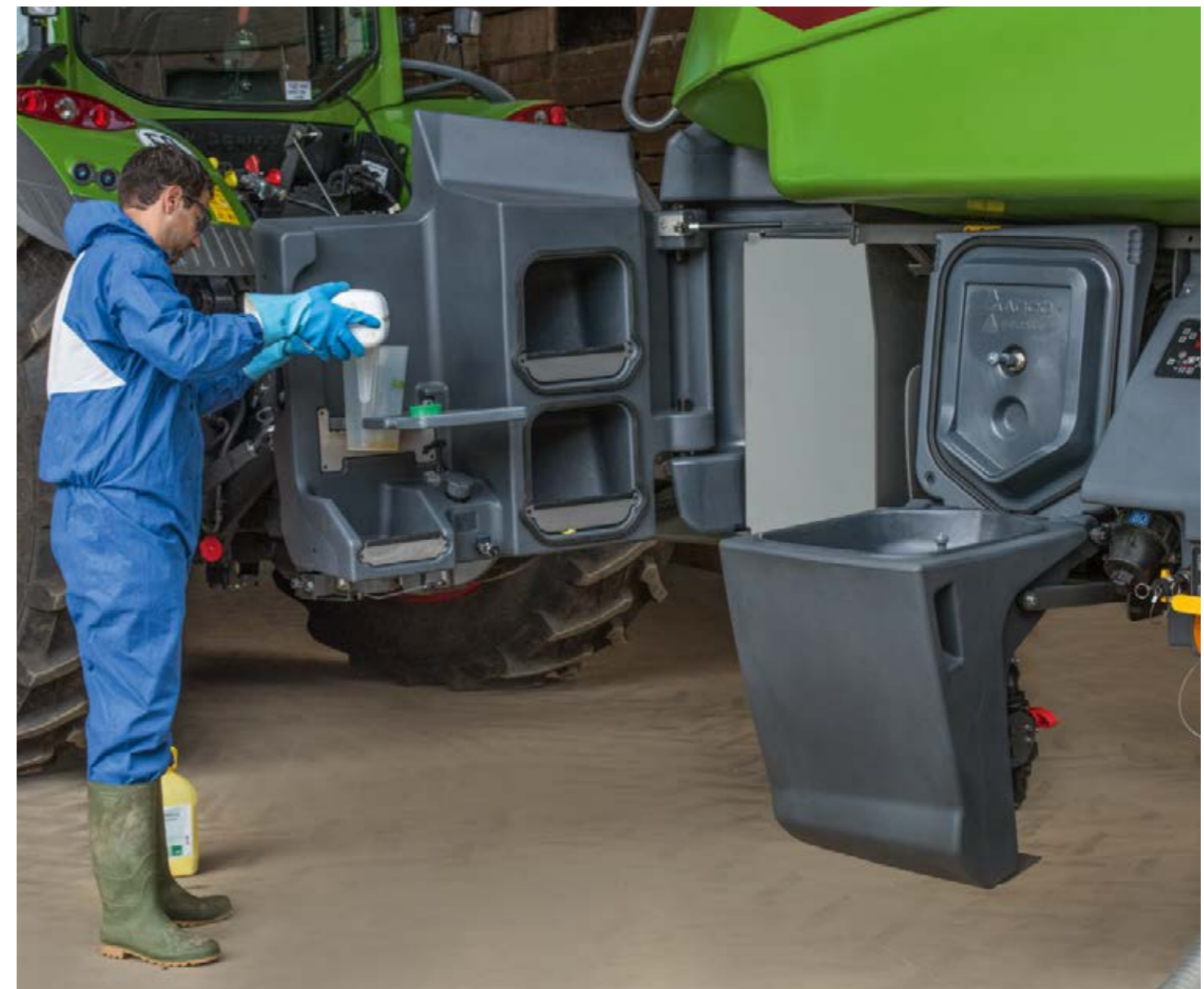
Le côté incorporeur, parfaitement rangé, minimise les durées d'immobilisation. Le Fendt Rogator est net, pratique et convivial.