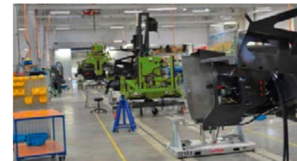
Notre chaîne de production des pulvérisateurs se situe sur le site de Fendt à Hohenmölsen.