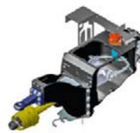
■ Attelage bas ou ...