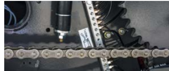
■ La quantité d'huile peut être séparément ajustée pour chaque chaîne.