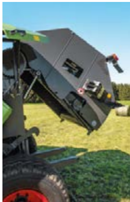
Un axe sur la porte arrière veille à sa fermeture correcte, même en pentes.