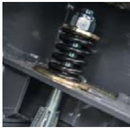
Les ressorts Flex absorbent les pics de charge à l'avant du fond de rotor, empêchant ainsi tout bourrage.