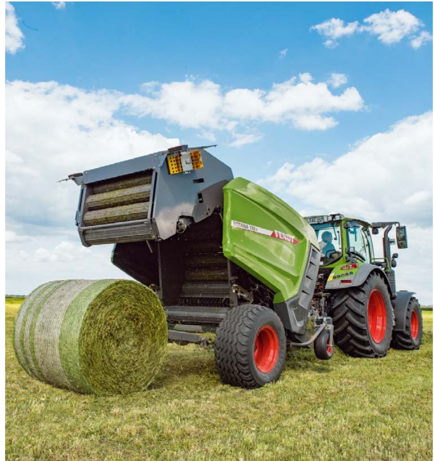
Des balles très fermes et homogènes : aucun problème grâce à tous les détails bien étudiés de la presse à balles rondes de Fendt.

Deux vérins simple effet ouvrent et ferment la porte de la chambre de pressage. Un distributeur simple effet suffit. Vous bénéficiez ainsi d'un déchargement plus rapide ; un tracteur Vario Fendt vous permettra d'augmenter la vitesse de travail en douceur et en continu, en l'espace de quelques secondes. Les tracteurs Fendt et les presses à balles forment ainsi un tandem idéal.