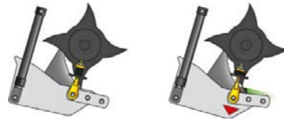
La fonction FlexControl empêche de façon fiable les bourrages.

La première fonction, appelée fonction « Flex », correspond à la suspension permanente du fond de rotor. Des ressorts sont utilisés pour amortir le fond du rotor de haut en bas afin de pouvoir répondre aux fluctuations de fourrage. La deuxième fonction est la fonction « Hydro ». Le fond du rotor peut être ouvert hydrauliquement de l'intérieur de la cabine grâce à deux vérins hydrauliques, sur simple pression d'un bouton, ce qui permet de libérer le rotor de tout blocage ou de changer les couteaux. L'HydroflexControl permet ainsi d'utiliser la machine sur une longue durée tout en garantissant un débit élevé.