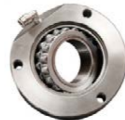
Ces roulements flexibles empêchent les charges axiales excessives, ce qui allonge considérablement leur durée de vie

« Flexibilité » est le mot clé lorsqu'il s'agit d'absorber des contraintes extrêmes dans différentes directions. L'expansion des balles dans la chambre de pressage exerce une pression sur les panneaux latéraux de la chambre et les fait légèrement bouger. Les presses à balles rondes Fendt sont par conséquent équipées de cages de roulement spéciales pour contrecarrer cet effet. Les cages sont fixées côté entraînement pour permettre aux roulements de bouger légèrement, tout en maintenant les rouleaux de pressage en place dans le sens longitudinal, pour que les pignons restent positionnés sur un même axe. Côté non-entraîné, les roulements peuvent se déplacer dans le sens longitudinal, ce qui permet de contrecarrer la pression de la balle sur les panneaux latéraux de la chambre de pressage et de l'absorber. Cela améliore de manière significative la durée de vie des roulements.