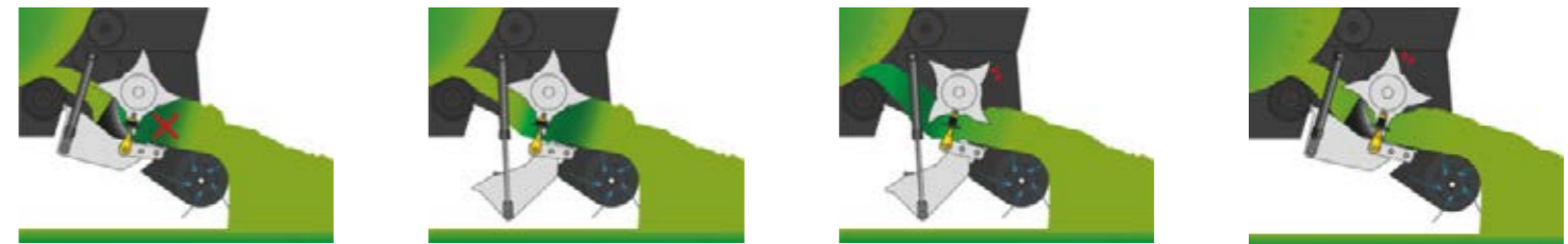
En cas de blocage éventuel, la partie arrière du fond de rotor est abaissée de 500 mm.